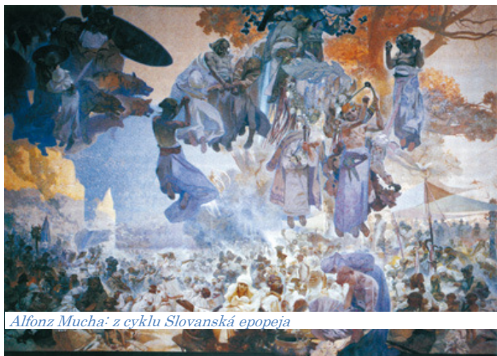
Alfonz Mucha: z cyklu Slovanská epopeja

a) Pomenujte hlavné udalosti a etapy slovenského národného obrodzenia. Objasnite hlavné udalosti a etapy slovenského národného obrodzenia. Analyzujte myšlienku slovanskej vzájomnosti v básnickej skladbe Slávy dcera .