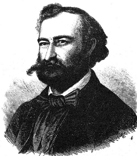
Jan Botto, básnik slovenský.