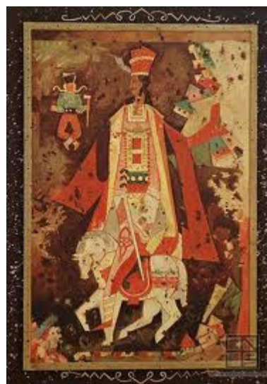
L. Fulla: Jánošík na koni

... Zahučali hory, zahučali doly — zanôtili chlapani: „Boli časy, boli! Boli časy, boli, ale sa minuli — po maličkovej chvíli minieme sa i my! Keď sa my minieme, minie sa krajina, akoby odlomil vrštek z rozmarína; keď sa my minieme, minie sa celý svet, akoby odpadol z červenej ruže kvet.“