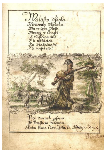
Ukážka rukopisného listu Valaská škola – mravúv stodola

a) Definujte barok ako umeleckú orientáciu 16. – 18. storočia. Uvedte slovenských autorov a ich diela v období baroka. Na základe literárnych ukážok a rozboru diel H. Gavloviča vysvetlite kriticko-sociálne a vlastenecké myšlienky v slovenskej barokovej literatúre. Na základe ilustrácií a ukážok načrtnite životnú púť a postoje H. Gavloviča.